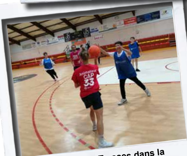
Cap33 tout l'été à Tresses dans la salle des sports.