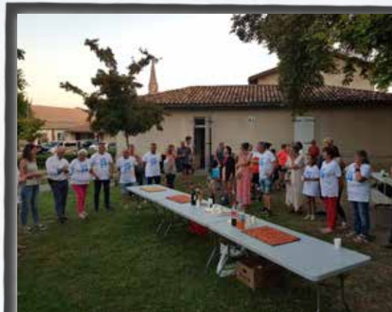
Clap de fin pour Cap33. Une édition 2021 qui a réuni beaucoup de monde.