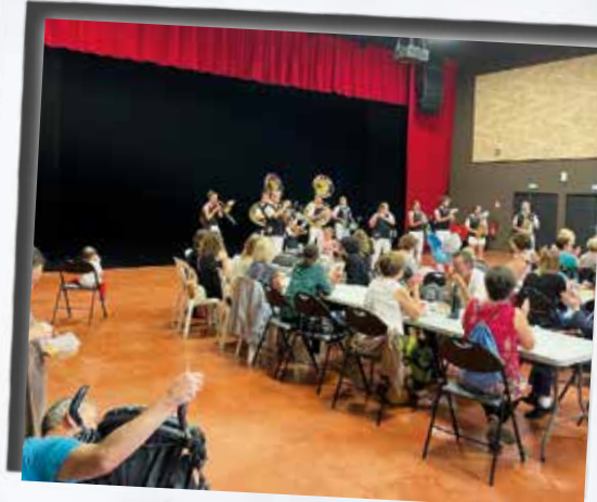
Le marché gourmand et sa banda dans la salle du Reflet.