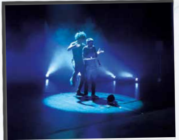
Concert de Titouan, jazz - hip hop - danse - beatbox, le soir de l'ouverture de la saison culturelle.