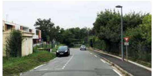
Exemple de stationnement sur chaussée

Le stationnement sur chaussée est autorisé en agglomération, le long du trottoir et dans le sens de la marche. La Commune de Tresses a engagé une réflexion avec les présidents et habitants des lotissements afin de créer des places de stationnement sur chaussée. Cette solution peu contraignante en termes d'équipements permet de sécuriser le stationnement et le passage des piétons tout en apaisant la vitesse des véhicules.