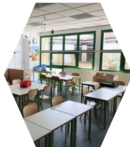
et à la remise en état et en sécurité pour l'accueil des enfants.

Mi-juin, des précipitations cataclysmiques ont inondé le bourg, certaines habitations et les écoles, en particulier l'école maternelle gravement touchée. Dans les jours qui ont suivi, la mobilisation de tous a permis la réouverture de l'école élémentaire et l'accueil temporaire des élèves de grande section tandis que les moyennes et petites sections étaient installées au pôle multisports de Pétrus.