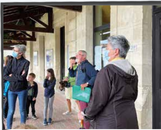
A la découverte de l'Histoire du village lors des Journées Européennes du Patrimoine.