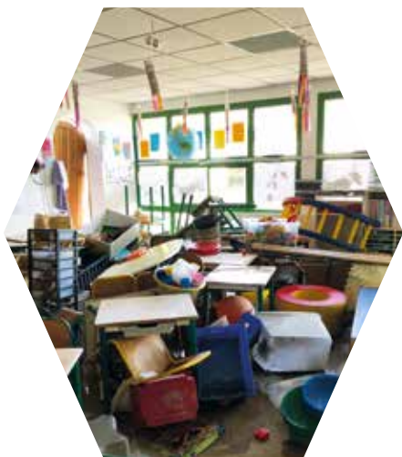
De la constatation des dégâts