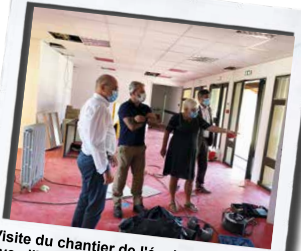
Visite du chantier de l'école maternelle avec l'Inspecteur de l'Education Nationale.