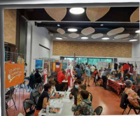
La fête des associations au Reflet avec distribution des chèques asso.