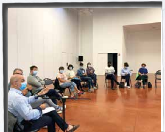
Première réunion du nouveau Forum Tressois.