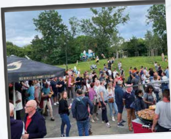
L'été s'ouvre avec le Marché gourmand.