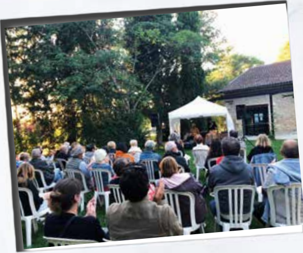
Concert de Strange o'clock au parc Marès.