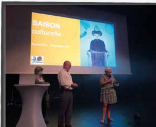
Ouverture de la saison culturelle de Tresses : 25 spectacles et de nombreuses animations.