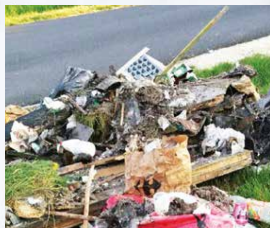
Stop aux dépôts sauvages sur la commune !