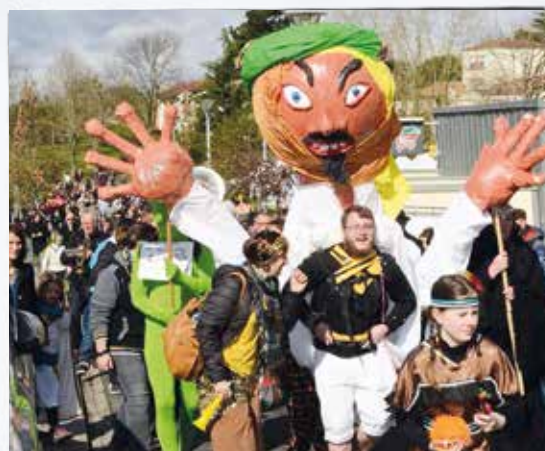
Défilé du carnaval un samedi matin sous les auspices du soleil...