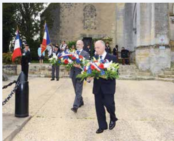
Cérémonie commémorative du 8 Mai 1945 aux monuments aux morts