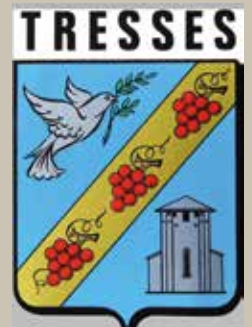
Affiche de 1909