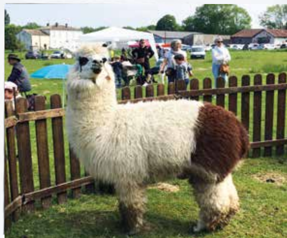
Animation caritative contre la mucoviscidose avec Aquitaine troupeau développement