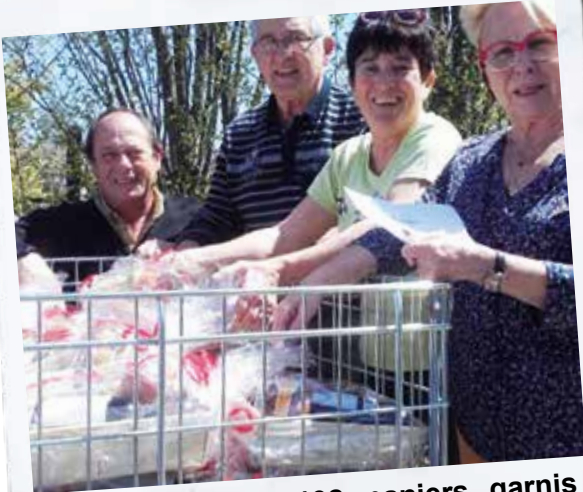
Distribution de 192 paniers garnis pour les seniors qui ne sont pas au repas des anciens