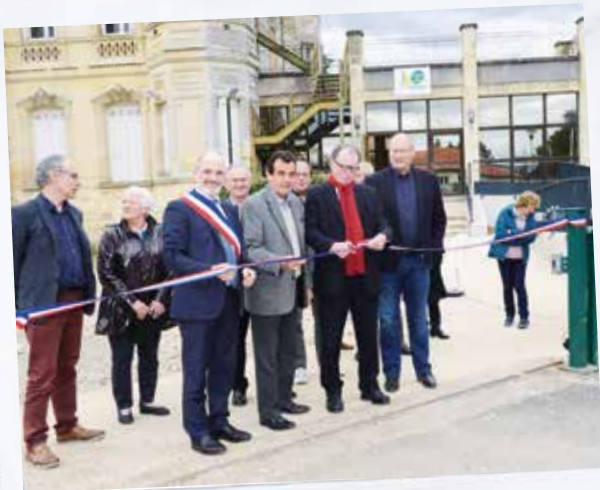
Inauguration des travaux de rénovation et de mise en accessibilité du centre de loisirs avec la CDC