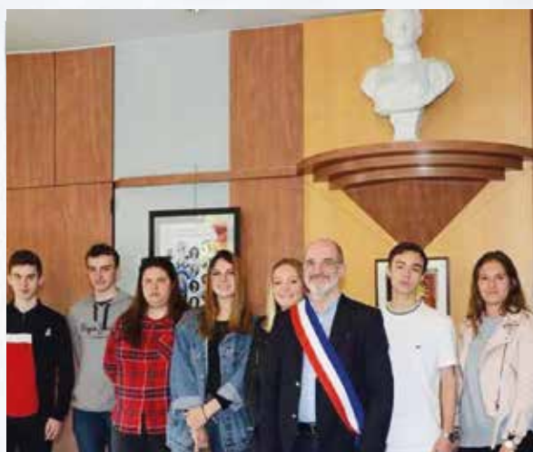
Cérémonie citoyenne : remise des cartes d'électeur aux jeunes majeurs de l'année