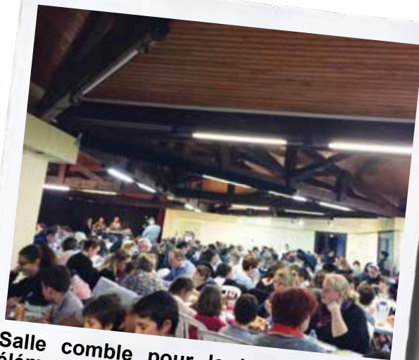
Salle comble pour le loto de l'école élémentaire