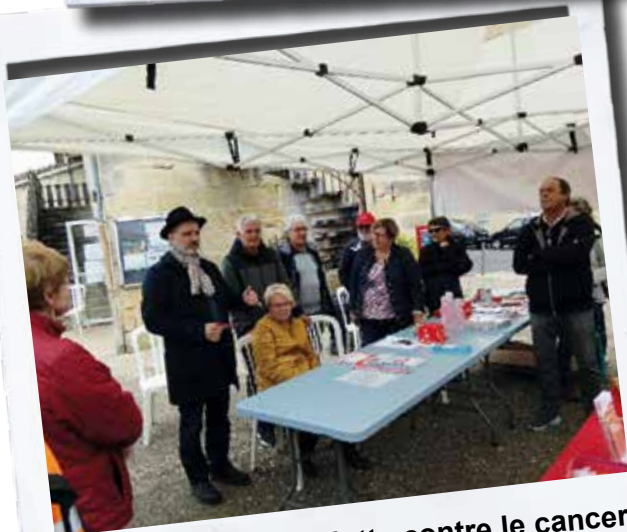
Parcours du coeur et lutte contre le cancer : Tresses solidaire