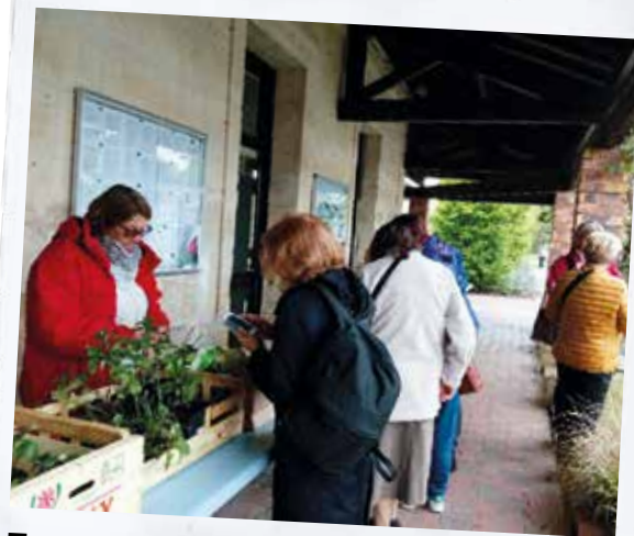
Troc plantes, graines, boutures, idées et informations pour la journée du développement durable