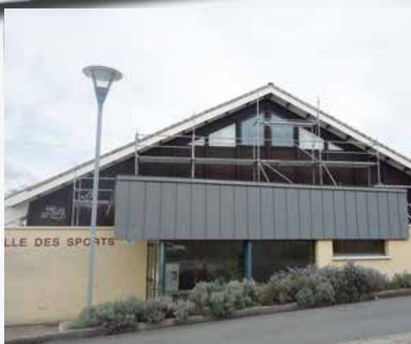
Fin des travaux de rénovation des pignons de la salle des sports.