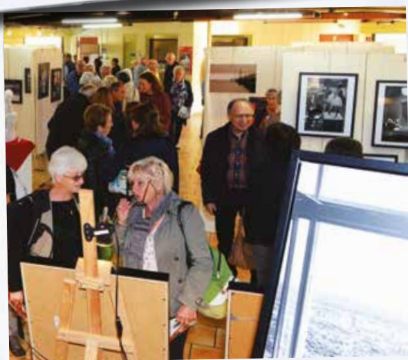
Exposition photographique annuelle, près de 140 oeuvres présentées au public.