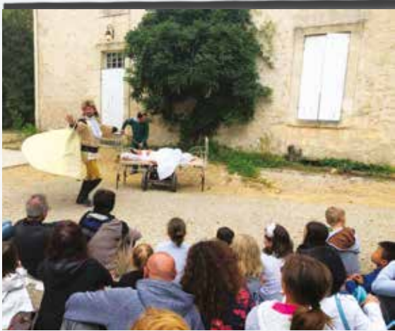
Festival Culture BazAar Spectacle «Dormeuse»