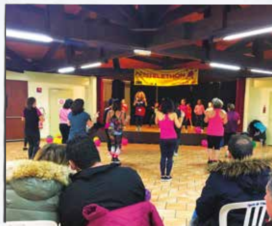
Téléthon 2018 - Initiation à la Zumba Environ 2 700 euros récoltés