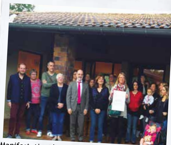
Manifestation des parents de l'école maternelle pour soutenir la demande d'ouverture de classe