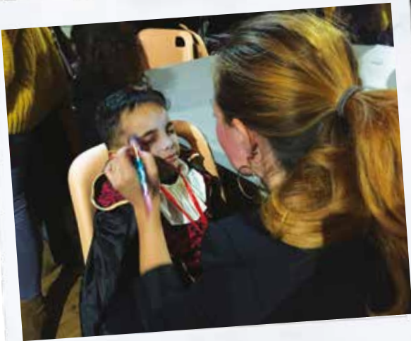
Boom d'Halloween, la métamorphose du vampire