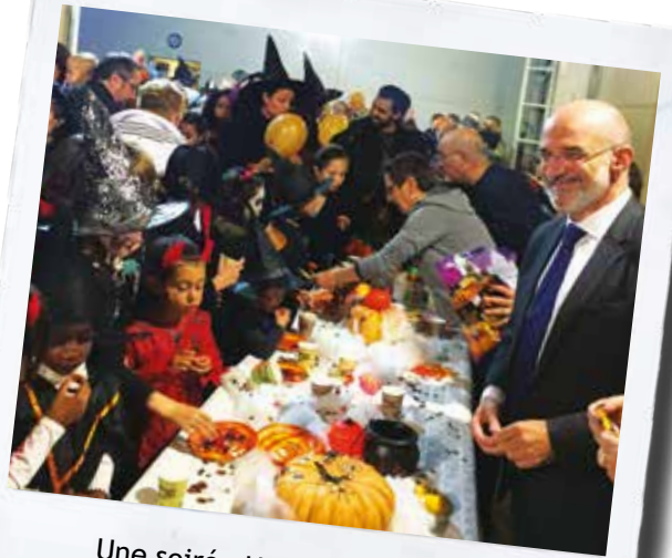
Une soirée Halloween musicale, festive... et gourmande