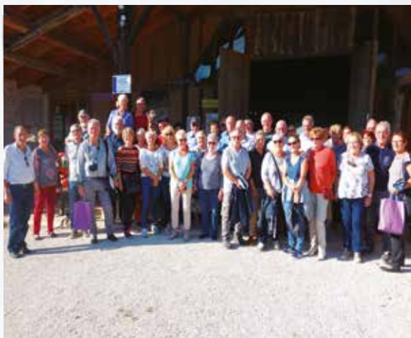
Patrimoine, gastronomie et convivialité pendant la Semaine Bleue