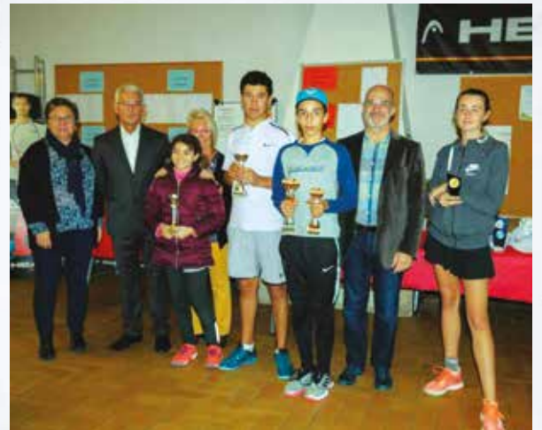
Remise des prix du 31 ème tournoi jeunes du Tennis Club, 150 inscrits de 12 à 18 ans, deux semaines de tournoi sur nos terrains