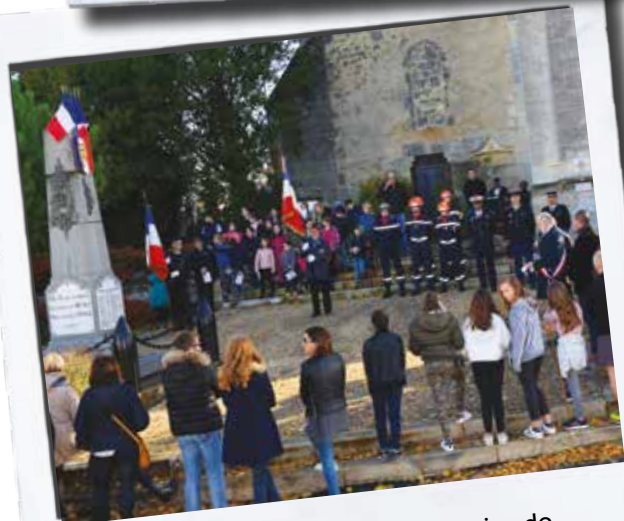
Commémorations du Centenaire de l'Armistice de la Grande Guerre