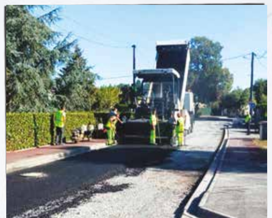
Travaux de réfection de la voirie Avenue de Mézac