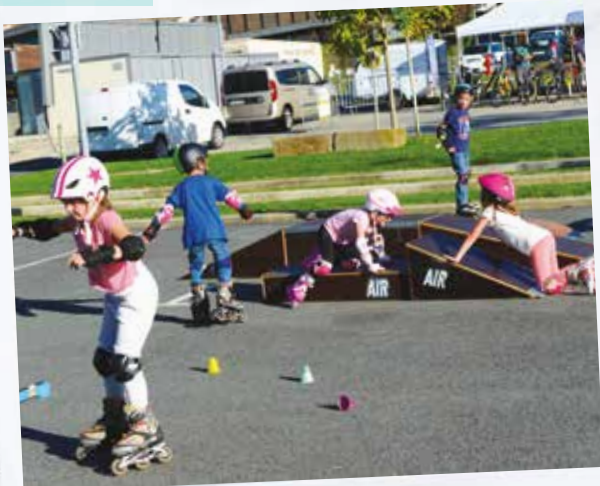
Initiation au roller durant l'après-midi Tresses'Cycle