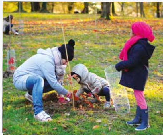
Journée de l'Arbre, plantations de chênes au Parc de la Séguinie